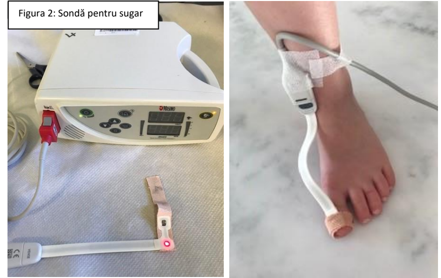
Figura 2: Sondă pentru sugar