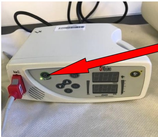
تقاطا لیغشت فاقیا / لیغشت رز